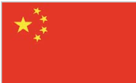
Die Nationalflagge Chinas