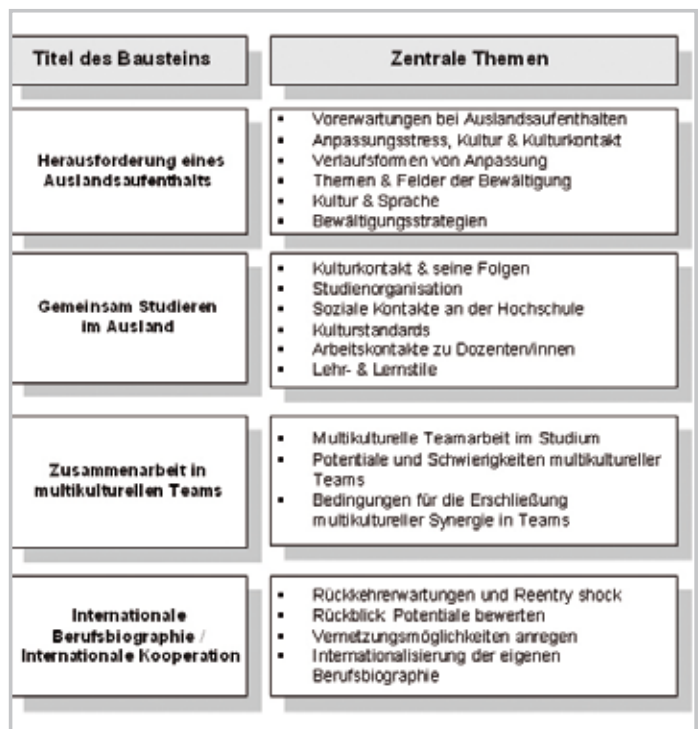
Abbildung 1: Aufbau der Workshop-Reihe zur interkulturellen Qualifizierung

Kulturelle Vielfalt an der Hochschule soll als Chance begriffen werden, die es produktiv zu nutzen gilt. Pro-FIT wird gemeinsam getragen vom International Office der FH Köln, dem Studienkolleg der FH Köln für ausländische Studierende und der Kompetenzplattform der FH Köln „Migration, interkulturelle Bildung und Organisationsentwicklung“. Der Campus Gummersbach engagiert sich aufgrund seines hohen Anteils ausländischer Studierender als Modellfakultät bei der Realisierung dieses Projektes. Eine zentrale Komponente von Pro-FIT ist eine Workshop-Reihe zur interkultu-