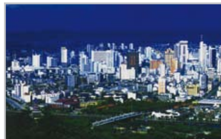
Wuxi, 130km westlich von Shanghai

Der eigentliche Standort ist Wuxi, welches im zentralen Yangtze Flussdelta knapp zwei Zugstunden entfernt von Shanghai liegt. Wuxi profitiert von seiner günstigen Lage am Kaiserkanal. Es gehört mit circa 7 Millionen Einwohnern zu den sogenannten mittelgroßen chinesischen Städten (China hat 180 Millionenstädte). Die Hochschule kann sich sehen lassen und lässt es an nichts - weder an multimedialer Ausstattung noch an geeigneten Vorlesungsräumen - fehlen. Einzig das Internet - wie allgemein bekannt in China ohnehin mit einer Reihe von Restriktionen behaftet - macht häufiger Probleme.