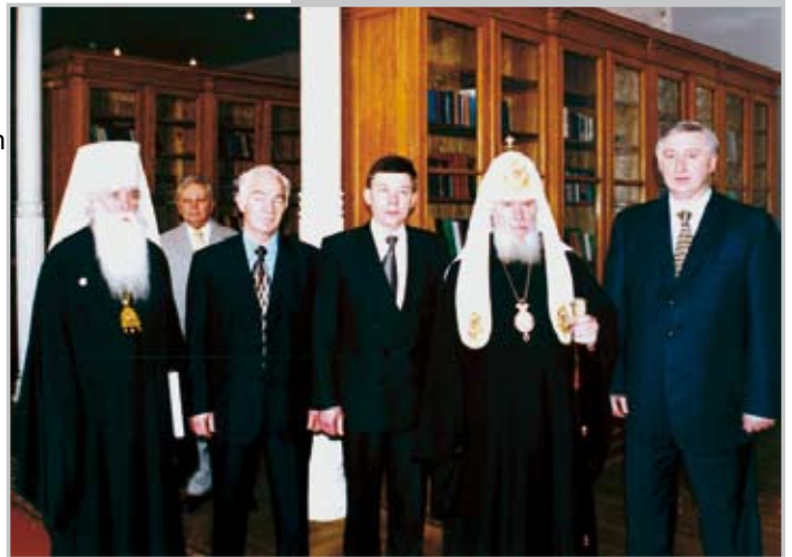
Empfang in der Universität für das Eisenbahn- und Verkehrswesen (MIIT) in Moskau

dass fehlende oder mangelnde Sprachkenntnisse kein wirkliches Hindernis für einen Auslandsaufenthalt darstellen. Ein typisches und vielfältig erprobtes Beispiel für einen Aufenthalt eines Gumpersbacher Studenten an einer französischen Partneruniversität nimmt folgenden Verlauf: Der Student mit vernachlässigbaren Französischkenntnissen wendet sich an den Internationalisierungsbeauftragten; gemeinsam mit dem Deutsch-Französischen Jugendwerk organisieren sie einen dreiwöchigen Sprachintensivkurs in Frankreich, anschließend geht der Student an die Gasthochschule und fertigt dort z. B. in einem Forschungslabor seine Diplomarbeit an. Am Ende seines ca. sechsmonatigen Aufenthalts schreibt er seine Diplomarbeit in Französisch und verteidigt seine Arbeit vor einem französisch-deutschen Gutachter-Gremium ebenfalls in französischer Sprache.