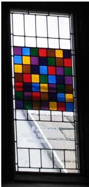
Abbildung 1. Glasfenster, das ein experimentelles Design darstellt. In jeder Zeile und jeder Spalte tritt jede Farbe nur einmal auf. Jede Farbe kann als die Einstellung eines Parameters interpretiert werden. Dieses Fenster wurde zu Ehren von R.A. Fisher (Statistiker und Genetiker) im Gonville and Caius College in Cambridge (UK) errichtet.

Neben dieser internationalen Sichtbarkeit gibt es eine enge Zusammenarbeit auf nationaler Ebene, die sich durch Mitgliedschaft und aktive Teilnahme an VDI/VDE Workshops und der Mitarbeit als Program Chair während des Workshops Hybrid Metaheuristics in Dortmund zeigt [15]. Hinzu kommen noch Gutachtertätigkeiten für diverse Fachzeitschriften und die Mitarbeit in zahlreichen Programmkomitees.